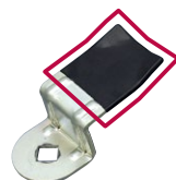
樹脂コーティング